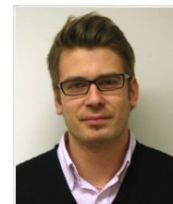
Olli Pekka Vanhanen